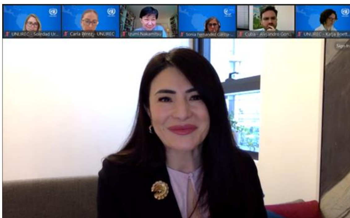
La Presidenta designada para las próxima Conferencia de Revisión, Embajadora Maritza Chan-Valverde de Costa Rica.

Él recordó el compromiso que dichos Estados asumieron en la Reunión Anual de la Hoja de Ruta del Caribe sobre Armas de Fuego, celebrada el año pasado, de abordar las cuestiones que alimentan el comercio ilícito y la proliferación de estas armas, como su suministro y el papel de la industria de las armas de fuego. Además, recordó a los participantes las sinergias entre el Programa de Acción de la ONU y los instrumentos regionales como la Convención Interamericana contra la Fabricación y el Tráfico Ilícitos de Armas de Fuego, Municiones, Explosivos y Otros Materiales Relacionados (CIFTA), y la Hoja de Ruta del Caribe sobre Armas de Fuego, de la que UNLIREC y CARICOM IMPACS son co-custodios.