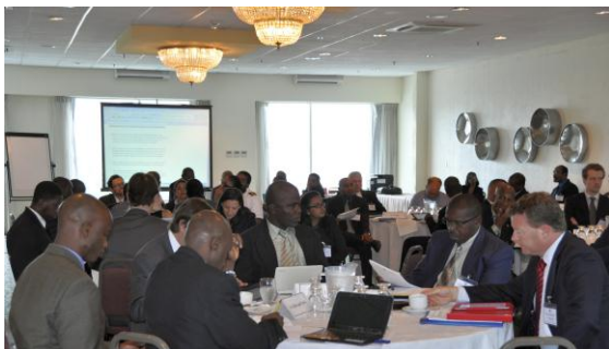
Muestra de participantes en la Mesa Redonda

(Puerto España, 21-22 de junio de 2012) – UNLIREC, en colaboración con el Gobierno de Trinidad y Tobago, acordaron una Mesa Redonda para la Lucha contra el Tráfico Ilícito de Armas Pequeñas y Ligeras a través de Controles Fronterizos Fortalecidos con el apoyo financiero de Australia, Canadá y Nueva Zelanda.