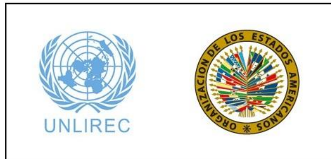
Logos de la OEA y UNLIREC

el Centro en la región como la principal entidad de las Naciones Unidas que proporciona asistencia en APL. El Secretario de la CIFTA, de igual manera, se unió a los Estados al reconocer la valiosa colaboración que comparte con UNLIREC sobre temas legales relacionados a armas pequeñas.