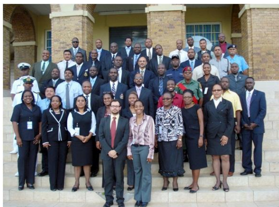
Participantes del CIIC subregional de UNLIREC, abril 2012 junto a los asesores de UNLIREC.

Desde el año 2004, UNLIREC ha capacitado a más de 3,300 oficiales de las fuerzas del orden en toda América Latina y el Caribe, fortaleciendo así las capacidades de los Estados en la región para abordar la problemática de la proliferación de y tráfico de armas ilícitas.