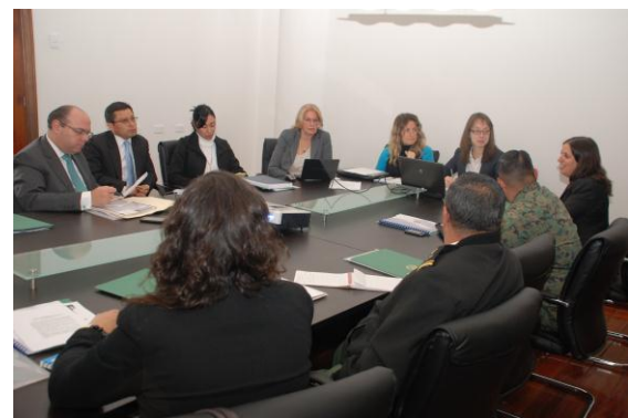
Participantes entablan un debate en el Taller.

(Quito, 26 de junio de 2012) – UNLIREC y su nuevo socio, el Centro de Verificación, Investigación, Formación e Información (VERTIC, por sus siglas en inglés) por primera vez unieron fuerzas para asistir mutuamente a Ecuador en su implementación de la Convención sobre Armas Biológicas y Tóxicas (CABT). Este intenso taller con duración de un día fue el resultado de una solicitud oficial por parte del país y fue realizado en colaboración con el Ministerio de Defensa de Ecuador.